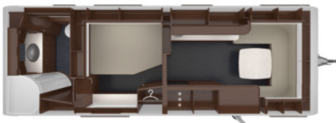
PUCINI 750 HTD 2,5