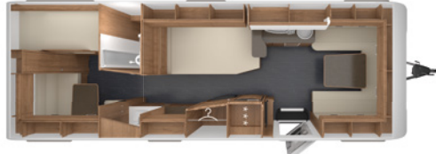
DA VINCI 700 KD 2,5